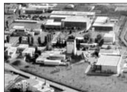
L'area del Laboratorio di Legnaro dell'Istituto Nazionale di Fisica Nucleare di Padova, uno dei centri di ricerca italiani più importanti in materia.

«I nuovi esperimenti che stiamo costruendo nel laboratorio CERN di Ginevra produrranno un flusso di dati imponente; per analizzarli bisognerà disporre di una potenza di calcolo enorme. La strategia scelta per affrontare il problema è di rendere possibile un utilizzo semplice delle potenze di calcolo distribuite. Così come il Web mette a disposizione informazioni su scala mondiale, Grid dovrebbe mettere a disposizione potenza di calcolo su scala diffusa. Si tratta di una struttura in cui ci sono centrali ed una rete che distribuisce: esiste proprio un parallelismo con la rete elettrica (in inglese "electrical power grid", n.d.r.). Qui a Padova la comprensione che il futu-